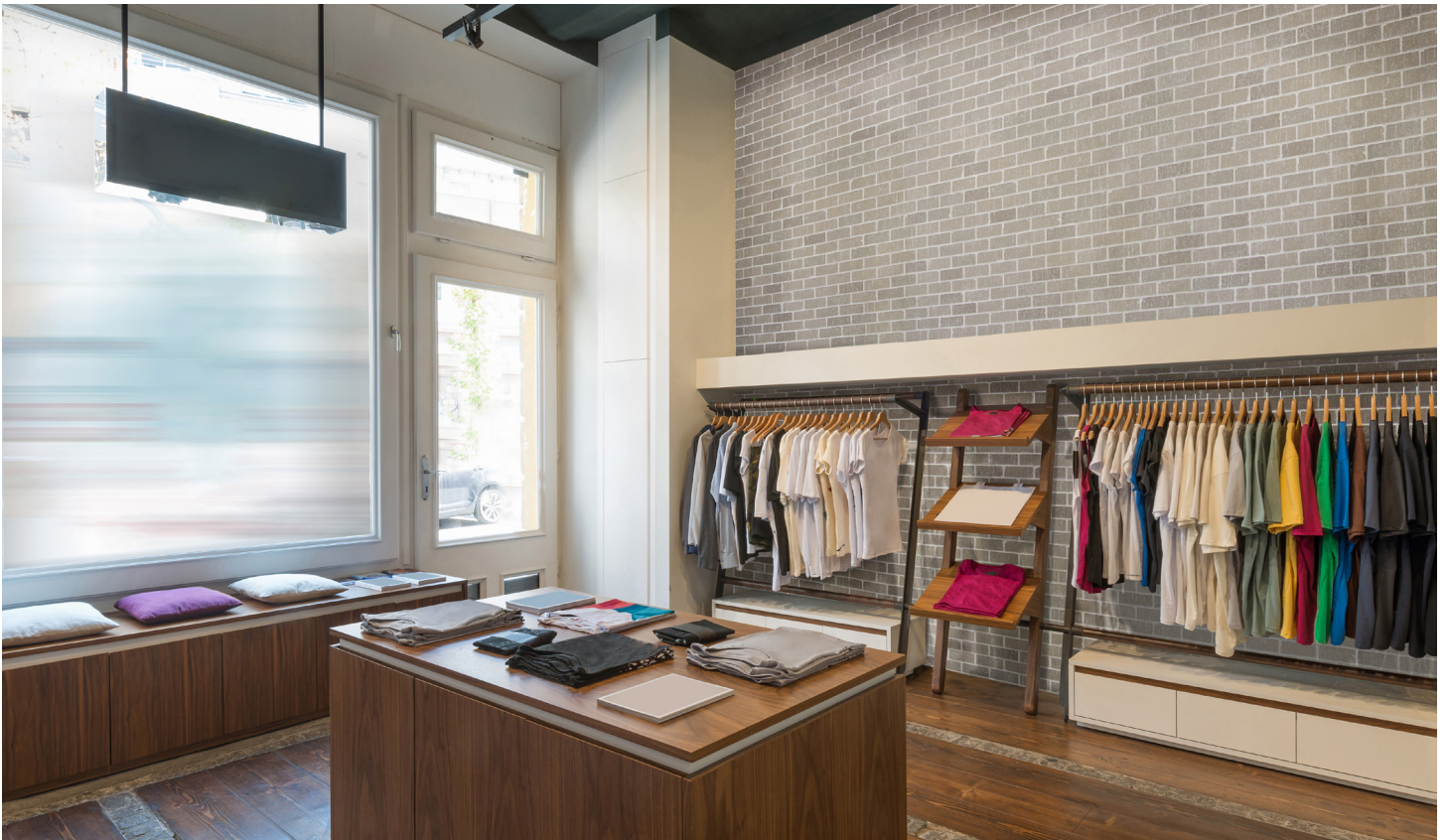
Mélange Newbury et Congress