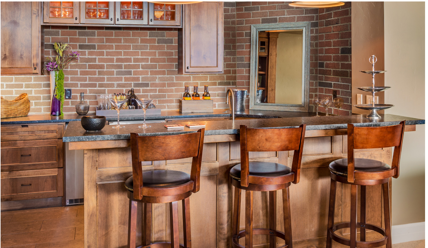
Mélange Cambridge et Congress